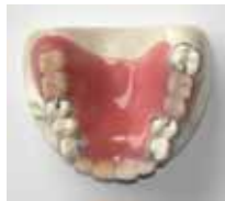
プラスチック義歯(上から)