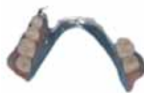
上)コバルトクロム