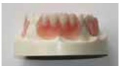
ノンクラスプ義歯(横から)