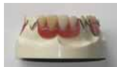
プラスチック義歯(横から)