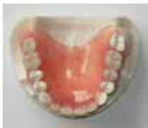
ノンクラスプ義歯(上から)