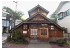
煮川の湯 町の外れにあるので、なかなか分かりにくい泉質は随一。

の共同浴場は二つあります。3年前に改装してきれいになった「地蔵の湯」と、地元の方が一番オススメする「煮川の湯」です。煮川の湯は湯船で体を動かすのさえ熱すぎて大変なほどですが、お湯の軟らかさと出た後のスッキリ感が熱いお湯を我慢してでも入る価値があるお湯だと思えます。個性豊かな共同浴場めぐりも来た際に試してみたいかがでしょうか。